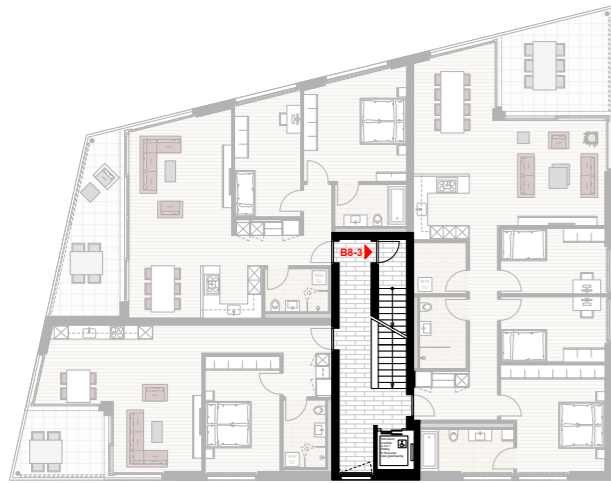
ZUGANG ÜBER TREPPENHAUS IM 3. OG (MASSSTAB UNBESTIMMT)